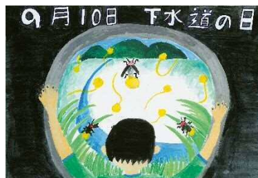
浦山陽翔さんの作品 (常葉小：当時5年)