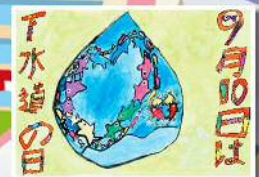
県北浄化センター 低学年の部