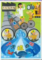
県中浄化センター 高学年の部