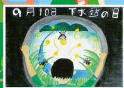
大滝根水環境センター 高学年の部