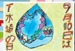
県北浄化センター 低学年の部