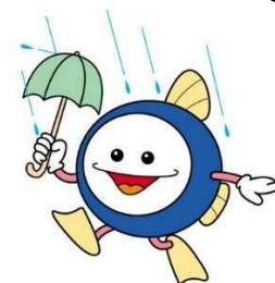
下水道マスコット キャラクター