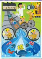
県中浄化センター 高学年の部