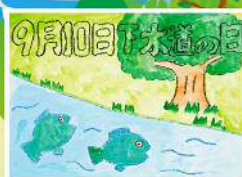
あだたら清流センター 低学年の部