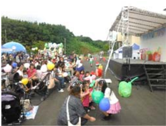
<大滝根水環境センター>

開催にあたりまして、ご協力をいただきました県、関係市及び関係団体の皆様に心より御礼を申し上げます。