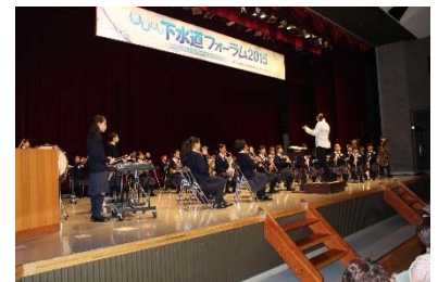
<伊達市立伊達小学校吹奏楽部>

本フォーラムの開催にあたり、ご支援、ご協力いただきました伊達市及び関係者の皆様に厚く御礼申し上げます。