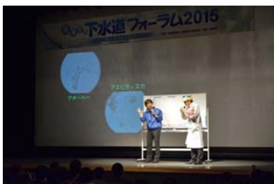
<“さかなクン”氏による記念講演>