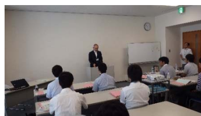
<下水道担当職員研修>