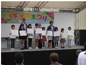
<ポスターコンクール表彰式>

開催にあたりまして、ご協力をいただきました県、関係市町村及び関係団体の皆様に心より御礼を申し上げます。