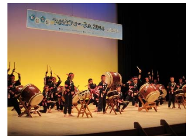
<笹原弘法太鼓育成保存会>