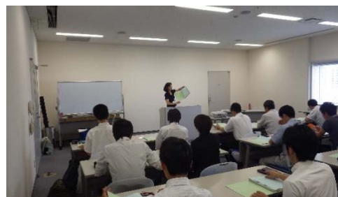
<下水道担当職員研修>

内 容：福島県における下水道事業、工事監督、 下水道管渠推進工法の設計・積算演習