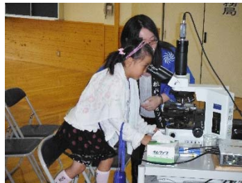
<下水道まつり・当日の実施風景>