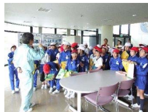
「下水道ふれあいバス」助成事業の実施風景（平成26年度）