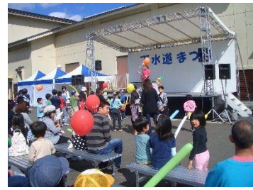
平成22年9月 下水道まつり（於：大滝根水環境センター）