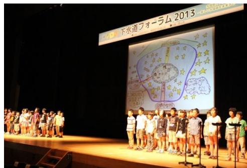
<郡山市立湖南小学校の皆さん>

続いて地域で水環境啓発活動を実践する団体の活動発表では、「郡山南川ホテル愛光会」と「郡山市立湖南小学校」の活動発表を行っていただき、水環境の大切さや地域での水環境への活動についてご報告頂きました。