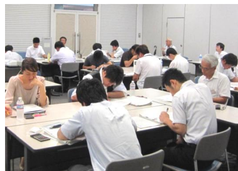
<下水道担当職員研修>

日 程：平成25年8月5～7日(2泊3日) 場 所：コラッセふくしま 内 容： 福島県における下水道事業、工事監督、管渠埋設の工法選定、設計・積算演習