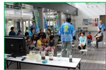
昨年のフォーラムの様子（会津若松市）