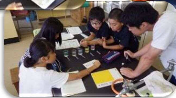
流入水、透明なジュースなどで 水の汚れを調べました (パックテスト)