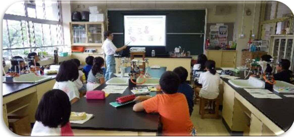
下水道の役割など説明し、水環境を学びました