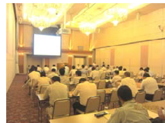
昨年の下水道維持管理研修会

■受講を希望される方は、8月16日（金）までに公社企画管理課まで連絡をお願いします。