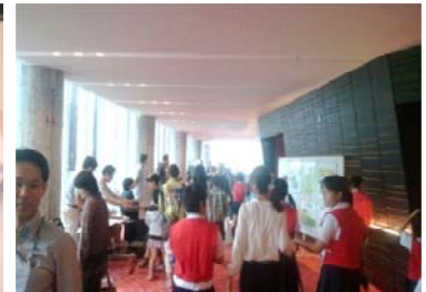
昨年のフォーラムの様子（いわき市）