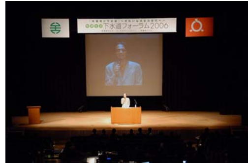
昨年開催した会場の様子