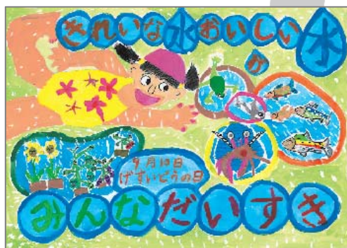
(H18 県北浄化センター・理事長賞作品)

“下水道ポスターコンクール”の入賞者については、各浄化センターで開催される「下水道まつり」会場にて、表彰式を行います。